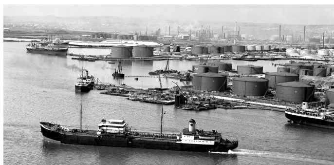
De raffinaderij op Curacao

De uitbreiding van de olieraffinaderij gedurende de Tweede Wereldoorlog heeft geleid tot een enorme uitbreiding van de economie van Curaçao. De welvaart nam door de uitbreiding enorm toe. Deze uitbreidingen waren het gevolg van de belangrijke rol die Curaçao in die periode had. Curaçao leverde geraffineerde producten zoals brandstof voor de oorlogsvliegtuigen en andere oorlogsvoertuigen van de geallieerden.